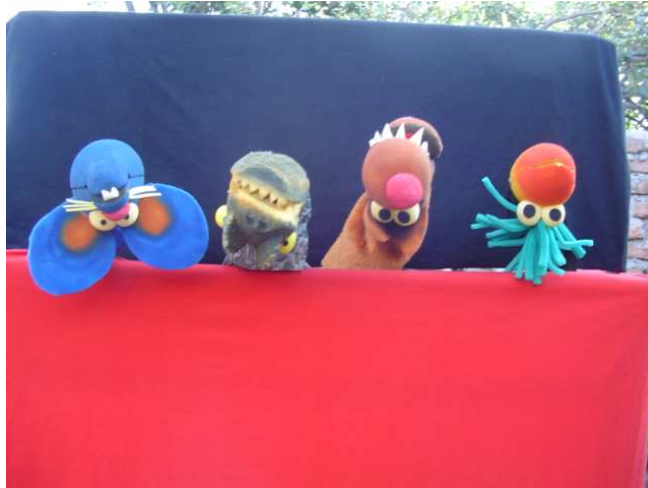
Ratón, Dinosaurio, Lobo y Tucán, al revés.