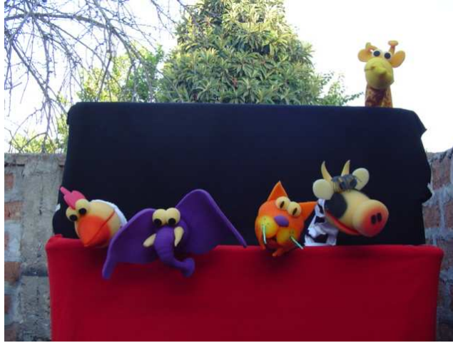
Foto 2. La Jirafa observa al resto de los animales.