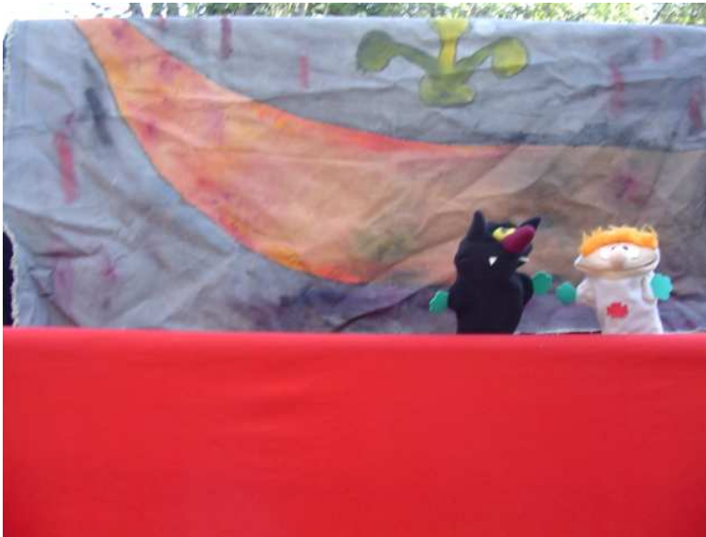
Orfeo y Plutón en el Averno.