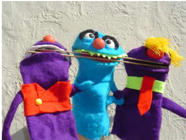
Los niños ociosos