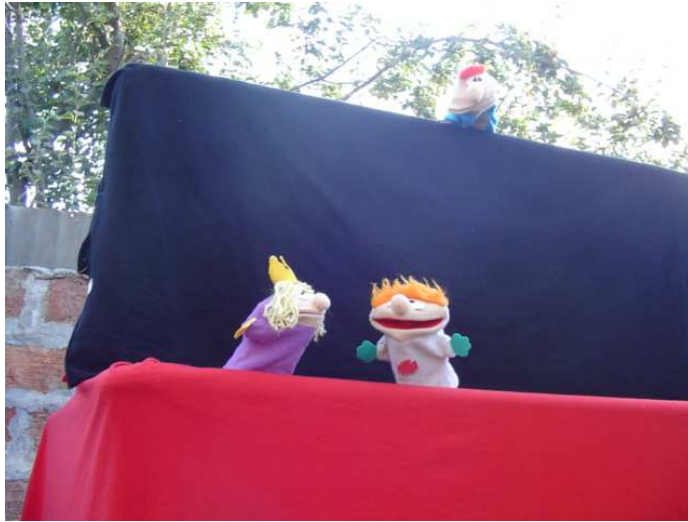
Cupido observando a Apolo y Dafne.