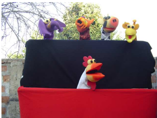
Foto 1. El canto del Gallo despierta a los animales.