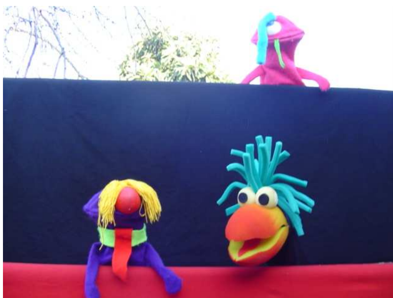
Cutipay observando a Gafotas y Duncan.