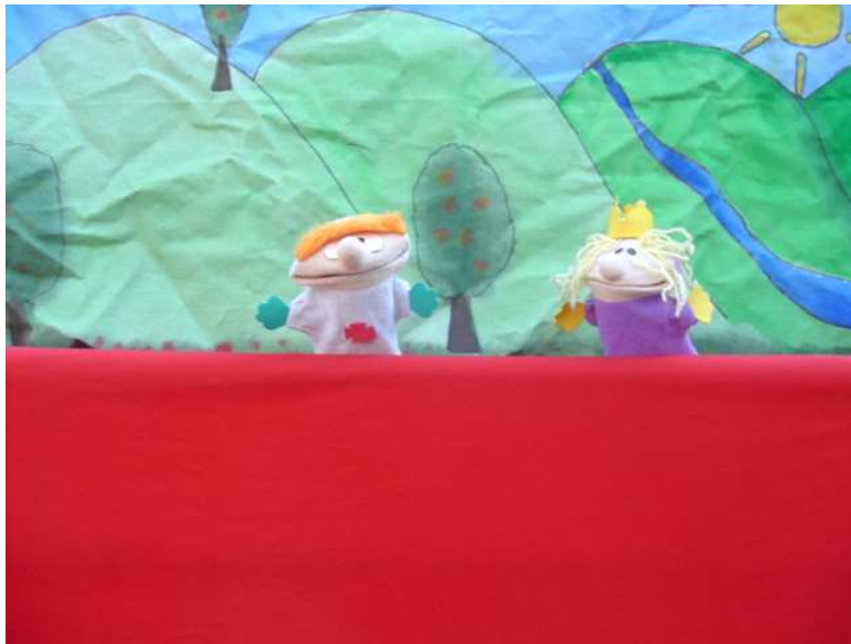
Orfeo y Eurídice en la Tierra.