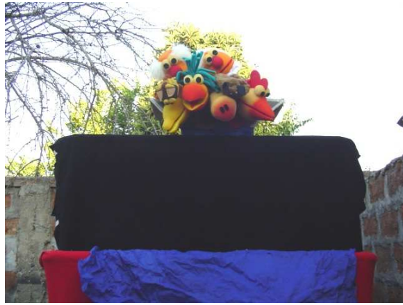
Foto 3. Noe, su esposa y los animales en el arca.