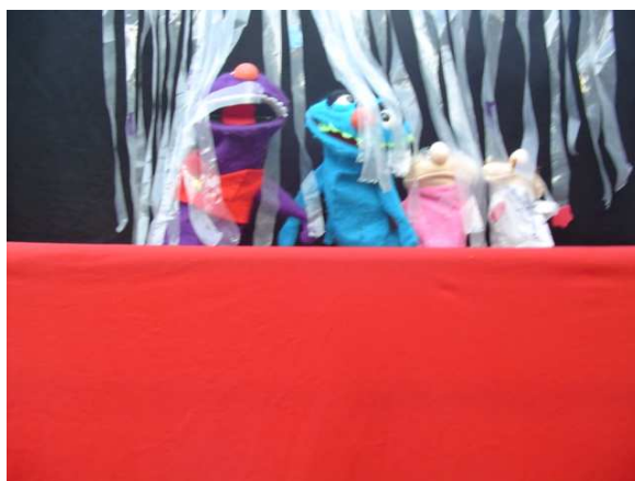
Foto1. Los gigantes y los hombres bajo la lluvia.