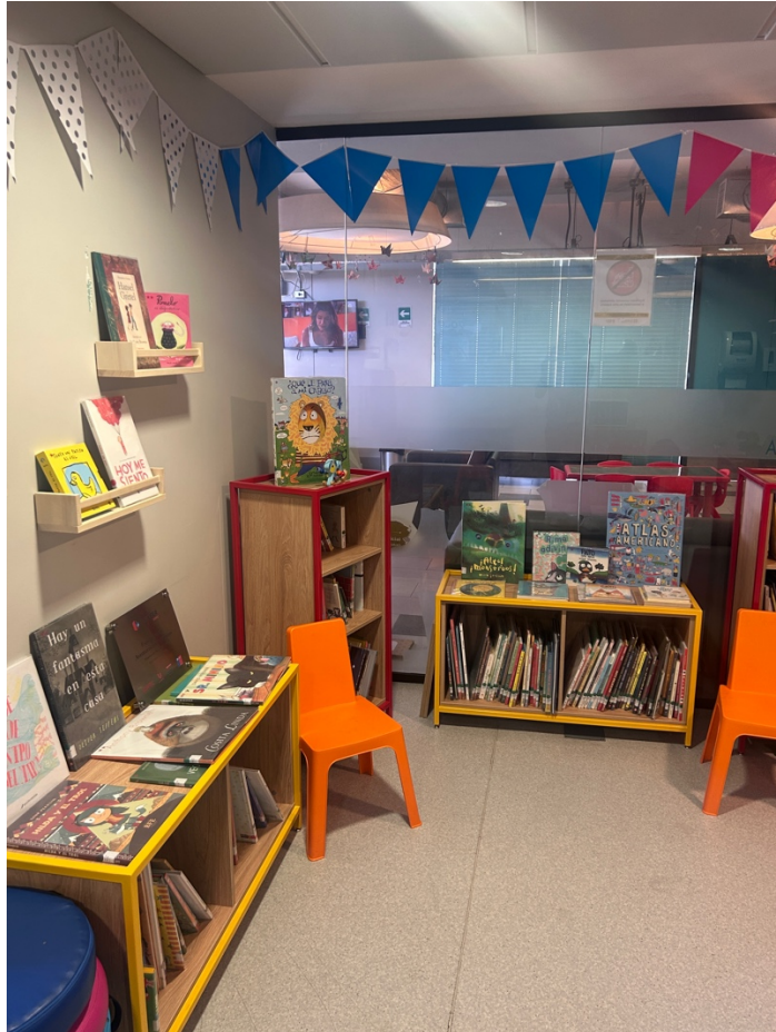
Espacio Lector Fundación Nuestros Hijos