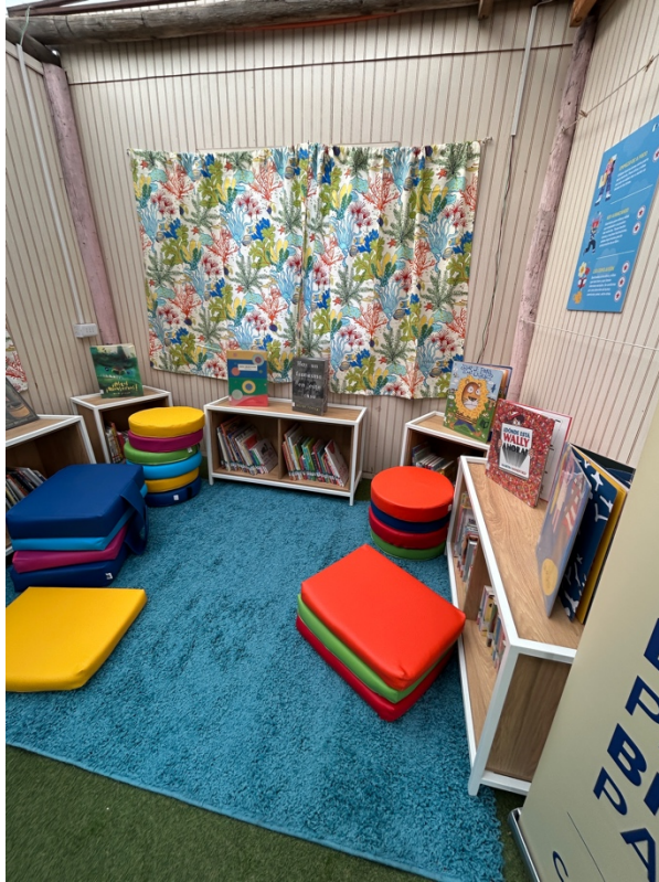
Espacio Lector Escuela Las Vegas, Llay Llay