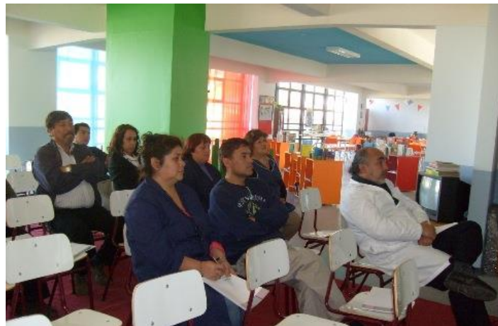
Educación Financiera Liceo Pedro Montt