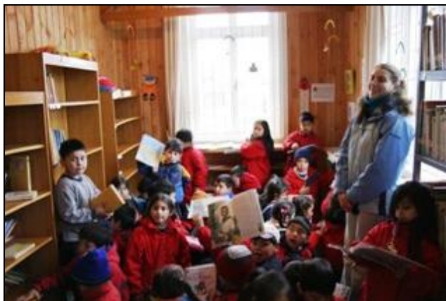
Biblioteca Pública, Puerto Octay, X Región