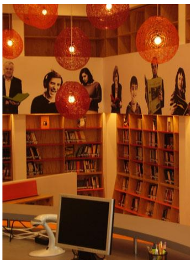
Biblioteca VIVA Mall Plaza Oeste.

Biblioteca VIVA constituye la primera biblioteca pública dentro de un centro comercial en Latinoamérica. A la fecha, Fundación La Fuente ha habilitado 11 bibliotecas en locaciones de la cadena de centros comerciales Mall Plaza, las cuales no sólo acercan la lectura y los libros a los usuarios, sino también la cultura, mediante actividades como teatro, exposiciones de arte, conciertos de música, etc.