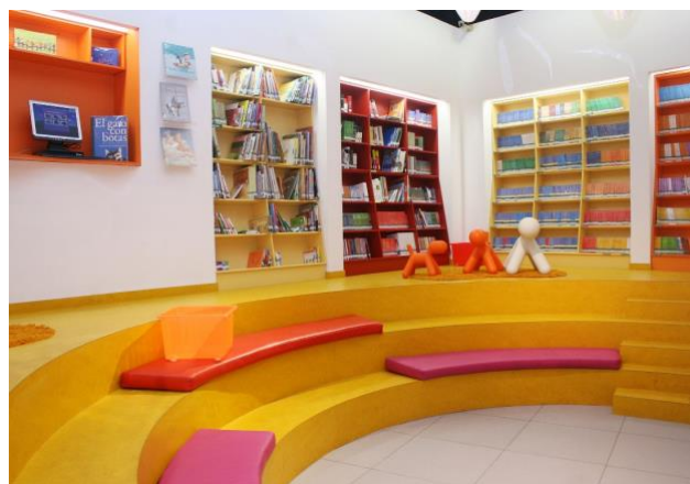
Biblioteca VIVA, Mall Plaza Tobalaba