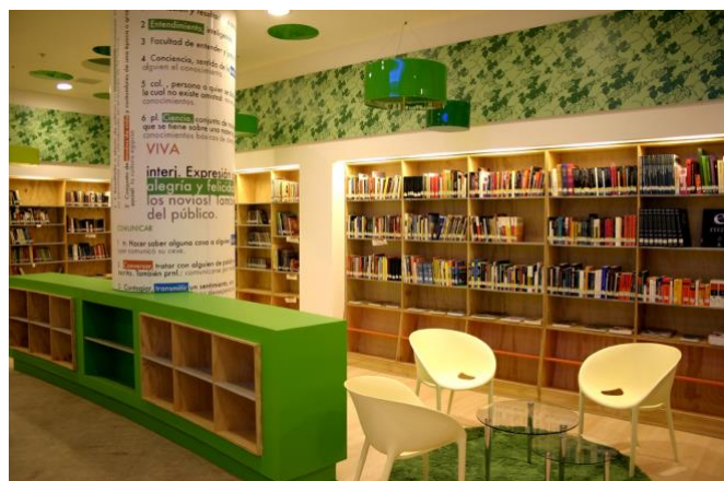
Biblioteca VIVA, Mall Plaza Los Ángeles