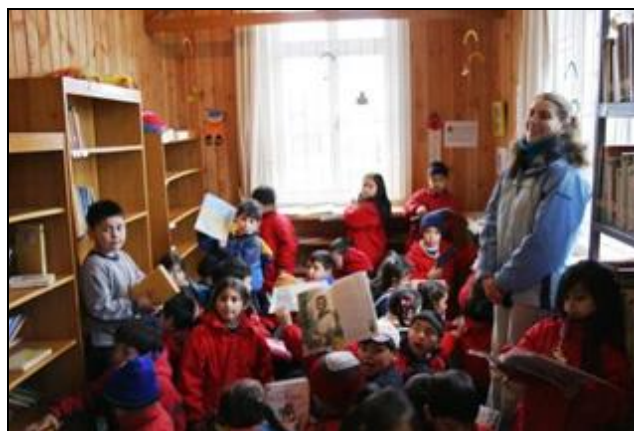
Biblioteca Pública, Puerto Octay, X Región