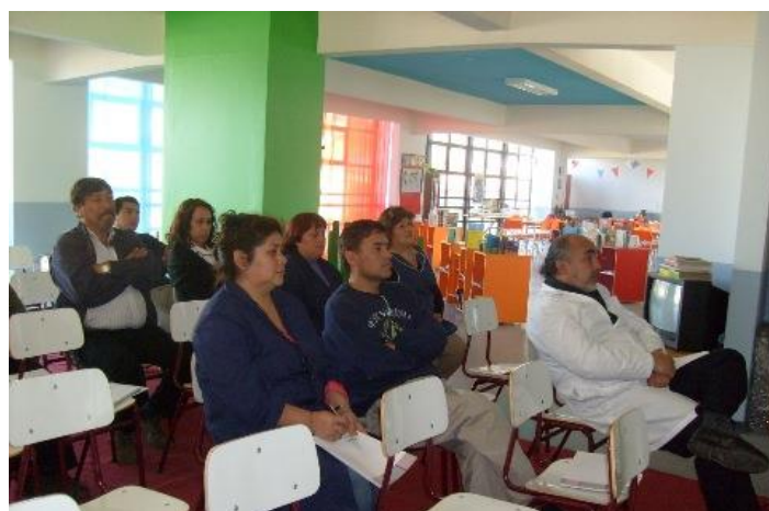
Educación Financiera Liceo Pedro Montt