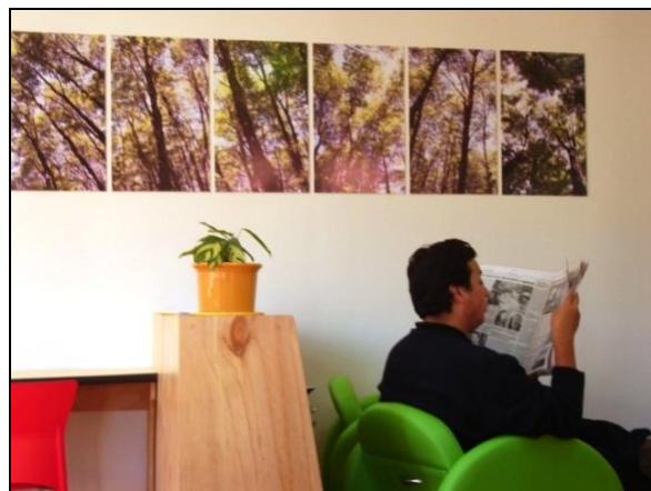
Biblioteca Pública Mariquina, XVI Región.