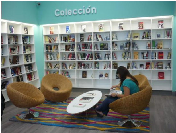
Biblioteca VIVA, Mall Plaza Sur