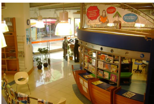
Biblioteca VIVA, Mall Plaza La Serena