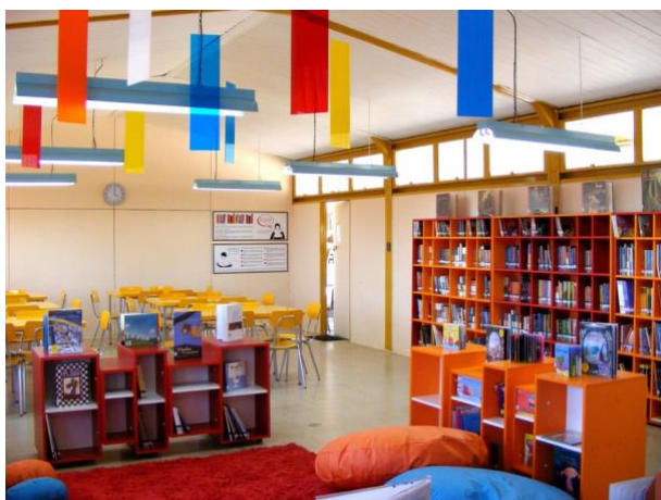
Biblioteca Escolar, Licantén, VII región