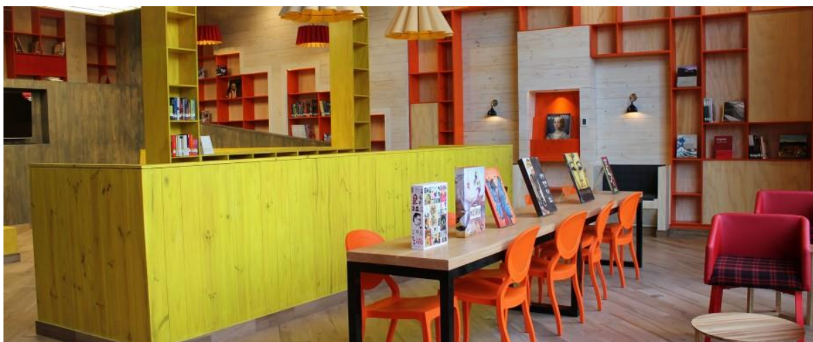
Biblioteca VIVA Mall Plaza Egaña

Biblioteca VIVA constituye la primera biblioteca pública dentro de un centro comercial en Latinoamérica. A la fecha, Fundación La Fuente ha habilitado 11 bibliotecas en locaciones de la cadena de centros comerciales Mall Plaza, las cuales no sólo acercan la lectura y los libros a los usuarios, sino también la cultura, mediante actividades como teatro, exposiciones de arte, conciertos de música, etc.