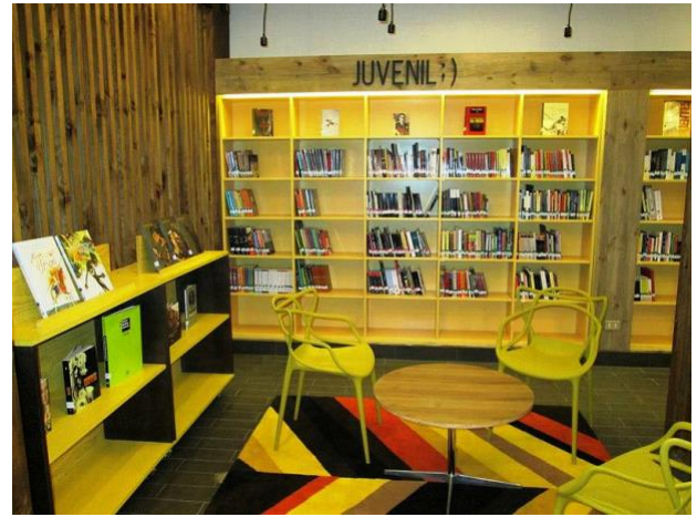
Biblioteca VIVA, Mall Plaza Biobío