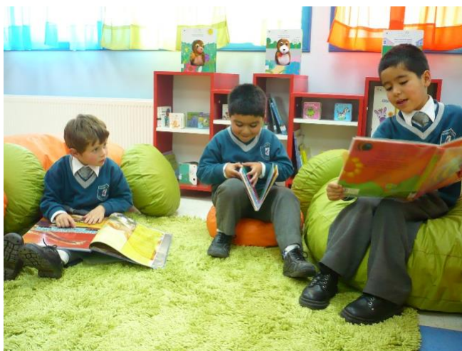
Biblioteca Escolar Calbuco, X región