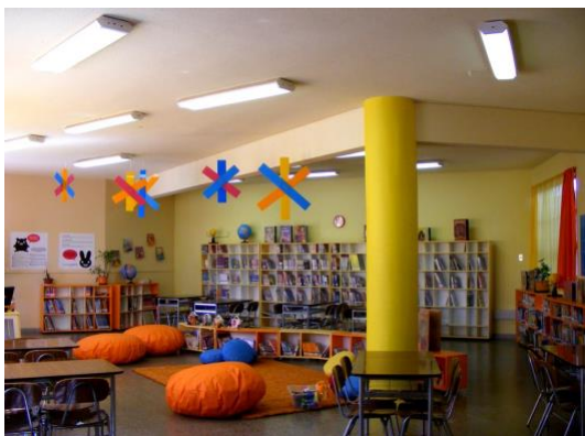
Biblioteca Escolar Escuela Villa Las Playas, Caldera