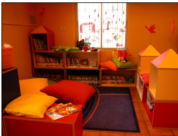
Biblioteca Pública, Puchuncaví, V Región