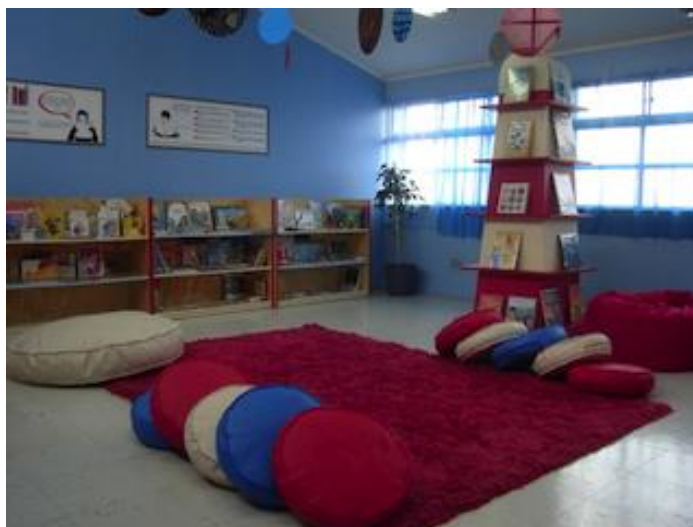
Biblioteca Escolar, Caldera, III Región.