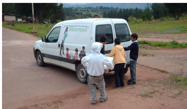
Bibliomóvil, Valle del Itata, VIII Región.